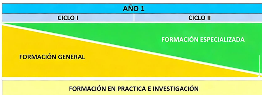
Componentes Curriculares del PPD

El Programa de Profesionalización Docente se organiza en tres componentes curriculares: formación general, formación específica y formación en práctica e investigación. Esta estructura contribuye a la formación integral del estudiante de PPD desde una visión sistémica y coherente, en la cual no se abordan contenidos de manera aislada, sino que se impulsa el desarrollo sinérgico de las competencias profesionales docentes que configuran el perfil de egreso.